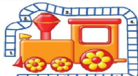
Ответы: 1. Англия 2. Платформа 3. Вагонетка 4. Завтрак 5. Рельсы 6. Вагон